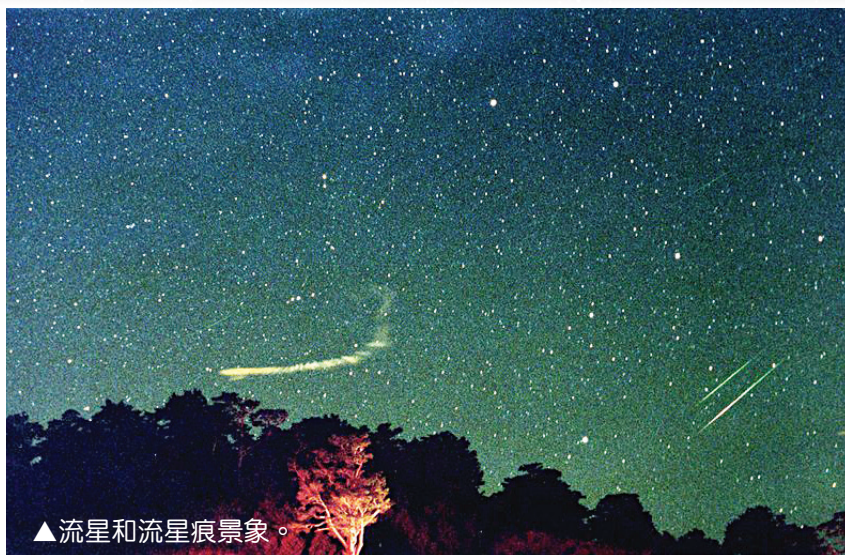
▲流星和流星痕景象。

本週五到週日晚上的十點到第二天天亮前，剛好是最適合觀察獵戶座流星雨的時間。今年這三天夜晚剛好遇上眉月，在流星雨開始之前，月亮就已西沉，因此，稍微暗一點的流星不會因月光的干擾而隱沒，觀星不受月光影響。這群流星的速度偏快，每秒可達六十六公里。